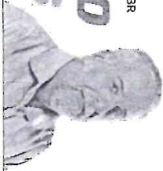
ESTRUCOLUNA E PUBLICADA AS SEITAS